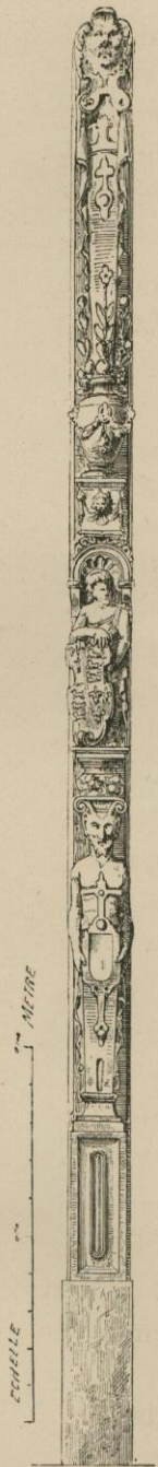
EMBLÈME ORNANT LA PORTE DES MAGASINS ANGLAIS RUE VÉ- NUS.

En tenant compte de la situation du pays, nous nous sommes demandé si ces voyages multiples ne se rapportaient pas à nos relations commerciales avec la Flandre et surtout avec Bruges à qui nous venions de restituer l'étape des laines?